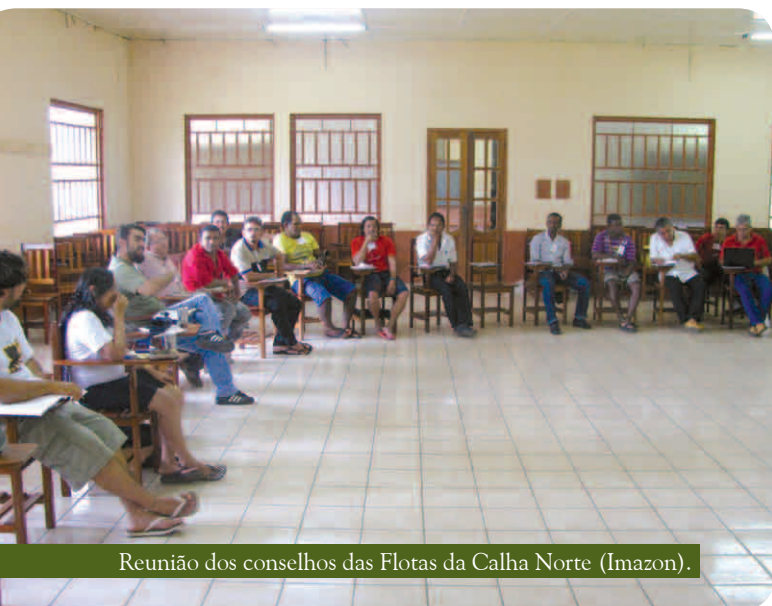
Reunião dos conselhos das Flotas da Calha Norte (Imazon).

A reunião ordinária dos Conselhos Consultivos das Flotas de Faro e Trombetas foi realizada nos dias 14 e 15 de setembro, no município de Santarém, e reuniu 18 conselheiros (13 conselheiros do Trombetas e 5 conselheiros de Faro). Os temas tratados foram: levantamento socioeconômico no interior da Flota de Faro, ordenamento territorial nas Flotas de Faro e Trombetas e encaminhamentos sobre os conflitos fundiários na Flota do Trombetas.