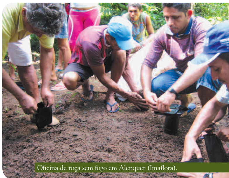
Oficina de roça sem fogo em Alenquer (Imaflora).

Em dezembro, a ACT Brasil promoveu o curso sobre sistemas de viabilidade em Terras Indígenas no Parque Nacional Montanhas do Tumucumaque e