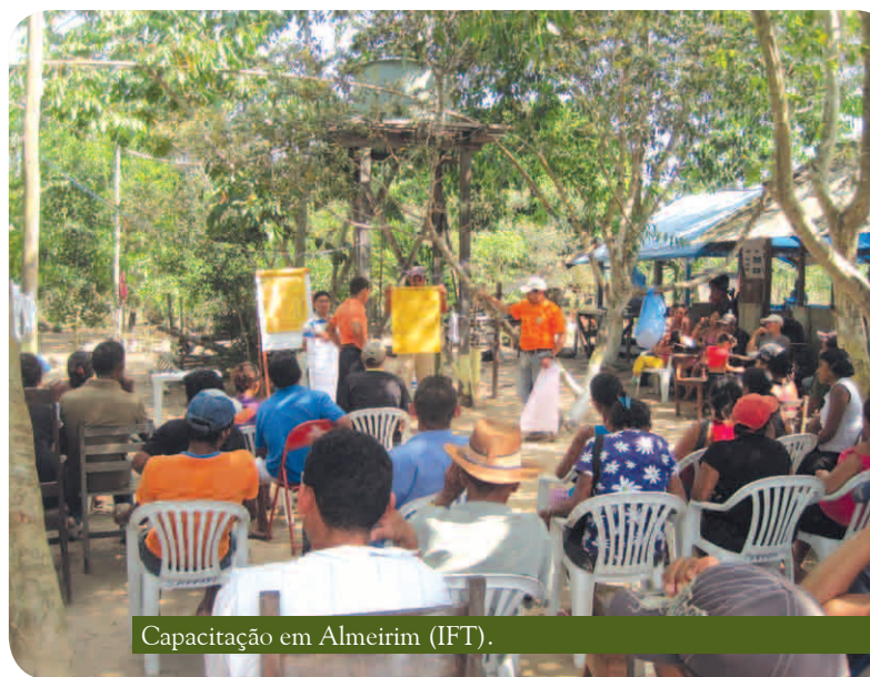
Capacitação em Almeirim (IFT).

nas aldeias da Terra Indígena Paru D'Oeste. A partir da capacitação em técnicas de comunicação visual, o curso teve o intuito de definir indicadores para monitorar as condições de sobrevivência nas comunidades indígenas nessas terras.