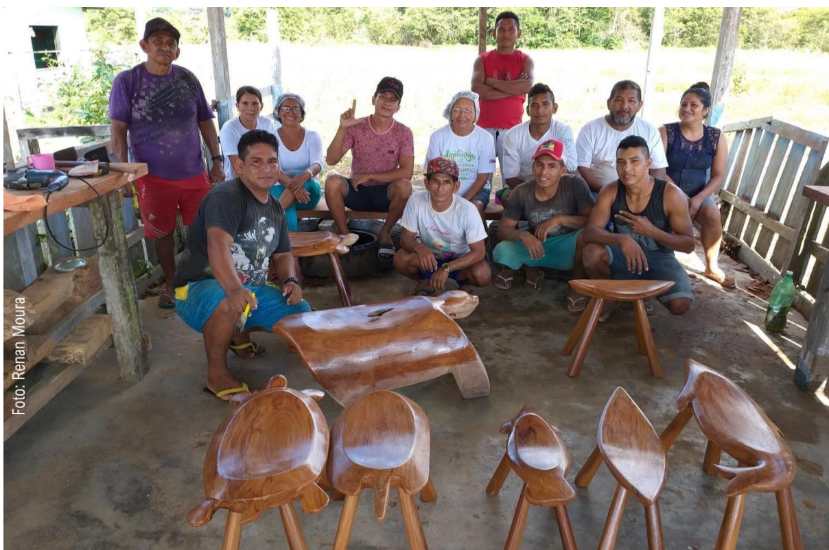
Figura 1. Móveis rústicos fabricados durante a capacitação em 2019.

Infelizmente, a empreitada não alcançou o sucesso desejado devido à escassez de matéria-prima nas proximidades, desafios logísticos e deficiências administrativas. Atualmente, o grupo tem a intenção de reorientar sua abordagem, concentrando-se na produção de pequenos artefatos em madeira. Essa decisão é fundamentada na abundância de recursos naturais na floresta e na perspectiva de mercado para esses produtos entre os visitantes que exploram a Unidade de Conservação. Nesse contexto, este edital foi divulgado com o propósito de fomentar o potencial madeireiro da comunidade e gerar renda por meio da confecção de pequenos objetos em madeira. Dessa maneira, promove-se a valorização tanto da Unidade de Conservação quanto dos trabalhadores, enaltecendo igualmente o papel da mulher e a autenticidade da cultura local.